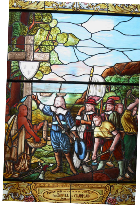
Vitrail intitulé Fondation de la Ville de Québec par Samuel de Champlain (juillet 1608)

Ces deux vitraux se trouvent à l'hôtel du Parlement à Québec. Le vitrail de gauche se situe au-dessus de l'escalier principal menant à la salle de l'Assemblée nationale et à la salle du Conseil législatif. Celui de droite est présent dans la salle des Drapeaux.