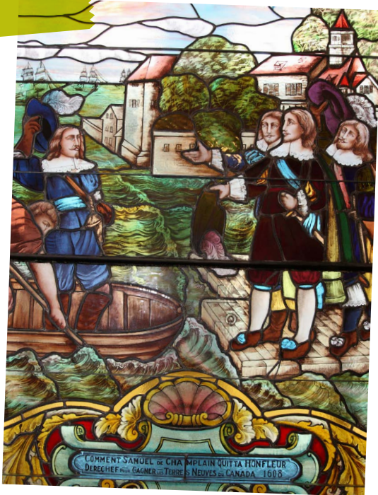
Vitrail intitulé Comment Samuel de Champlain quitta Honfleur Derechef pour gagner les terres neuves du Canada (avril 1608)