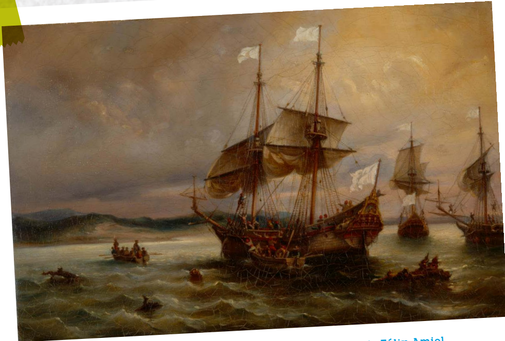
L'Arrivée de Jacques Cartier à Québec, tableau peint par Louis-Félix Amiel, entre 1835 et 1860

Après quelques tentatives de colonisation, notamment celle du baron de Léry et de Saint-Just en 1518 sur l'île de Sable, près de la Nouvelle-Écosse, Jacques Cartier est invité par le roi François I er à explorer le territoire en son nom. Il quitte donc Saint-Malo, le 20 avril 1534, et arrive en Amérique 20 jours plus tard.