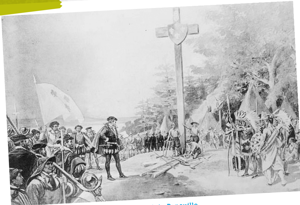
Jacques Cartier dressant sa croix à la Pointe Penouille

Utilisez l'une de ces images comme point de départ de votre récit de voyage.